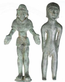
Statuettes ibères (4000 av. J-C-1 er siècle après JC)