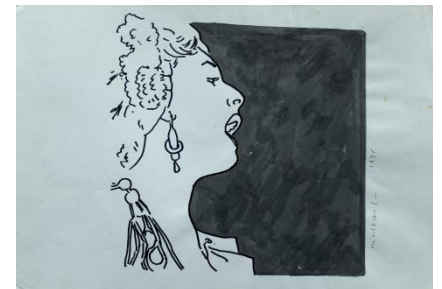
Flamenco, 2018 Coll. part.

1 visite + 2 ateliers - cycle 2 - 3 et secondaire