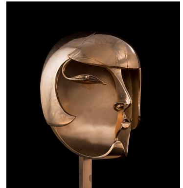
Pablo Gargallo Kiki de Montparnasse, 1928.

1 visite + 2 ateliers - cycle 2 - 3 et secondaire