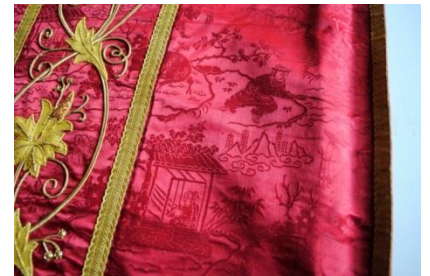
Tissu liturgique - détail -

1 visite + 2 ateliers - cycle 2 - 3 et secondaire